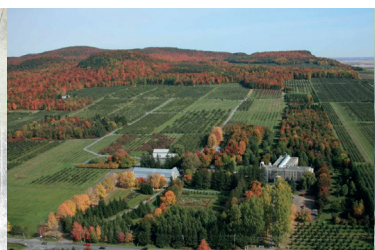
La Chambre haute