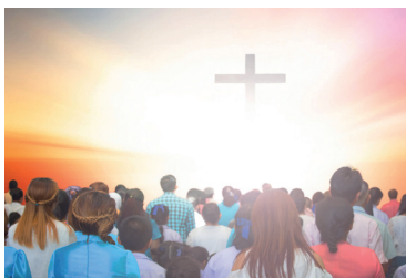
QUÊTE SPIRITUELLE Yannick Fouda Projet Propulsion Project