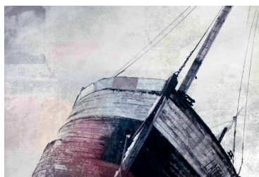
L'Heureux naufrage, la genèse du film

Écouter, accueillir et comprendre l'autre, saisir les aspirations des jeunes à travers leur mode de vie, cette attitude nous conduit à voir avec leurs yeux et à anticiper d'autres manières de vivre le message du Christ, l'Évangile, parole de salut et de bonheur. N'est-ce pas eux qui nous font redécouvrir la force vive de cet Évangile? François avait vu juste quand il a lancé le Synode sur la jeunesse pour l'année 2018. «Saint Benoît recommandait aux abbés de consulter aussi les jeunes avant toute décision importante, parce que, souvent Dieu révèle à un plus jeune ce qui est meilleur».