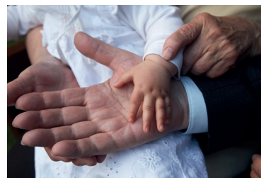
EN PLEINE ACTION Lévi Cossette, ofm Quel grand-papa !!!!