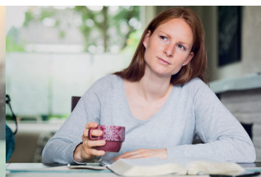
Quête de sens chez les jeunes