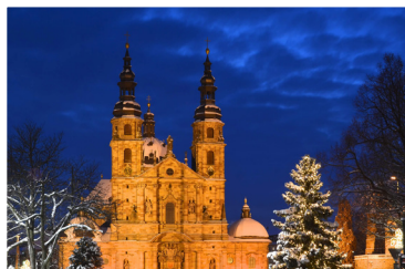
En pleine action L'espérance au présent Lévi Cossette