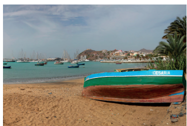
AILLEURS DANS LE MONDE Silvino Benetti, ofmcap Quand l'espérance des jeunes devient action