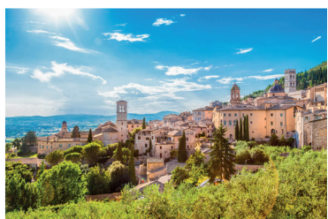
Solidaire de son temps, enraciné dans l'amour

Nous vous offrons cinq chroniques. Elles ne sont pas sans lien avec l'attitude de sérénité et les gestes d'espérance face aux transformations.