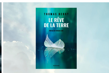
AU CŒUR DES MOTS Le rêve de la terre Roger Bélisle

Les 4 chroniques nous amènent à différentes manières de vivre la paix.